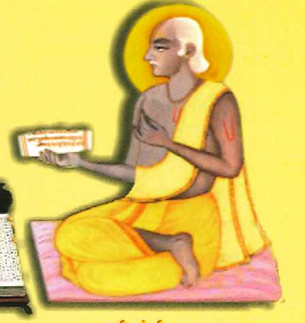
જગદ્ગુરુ શ્રીગોપીનાથ પ્રભુચરણ

આ જ સાધન દીપિકા ની સૈદ્ધાંતિક પીઠીકા છે.