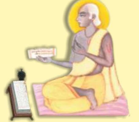
જગદ્ગુરુ શ્રીગોપીનાથજી પ્રભુચરણ